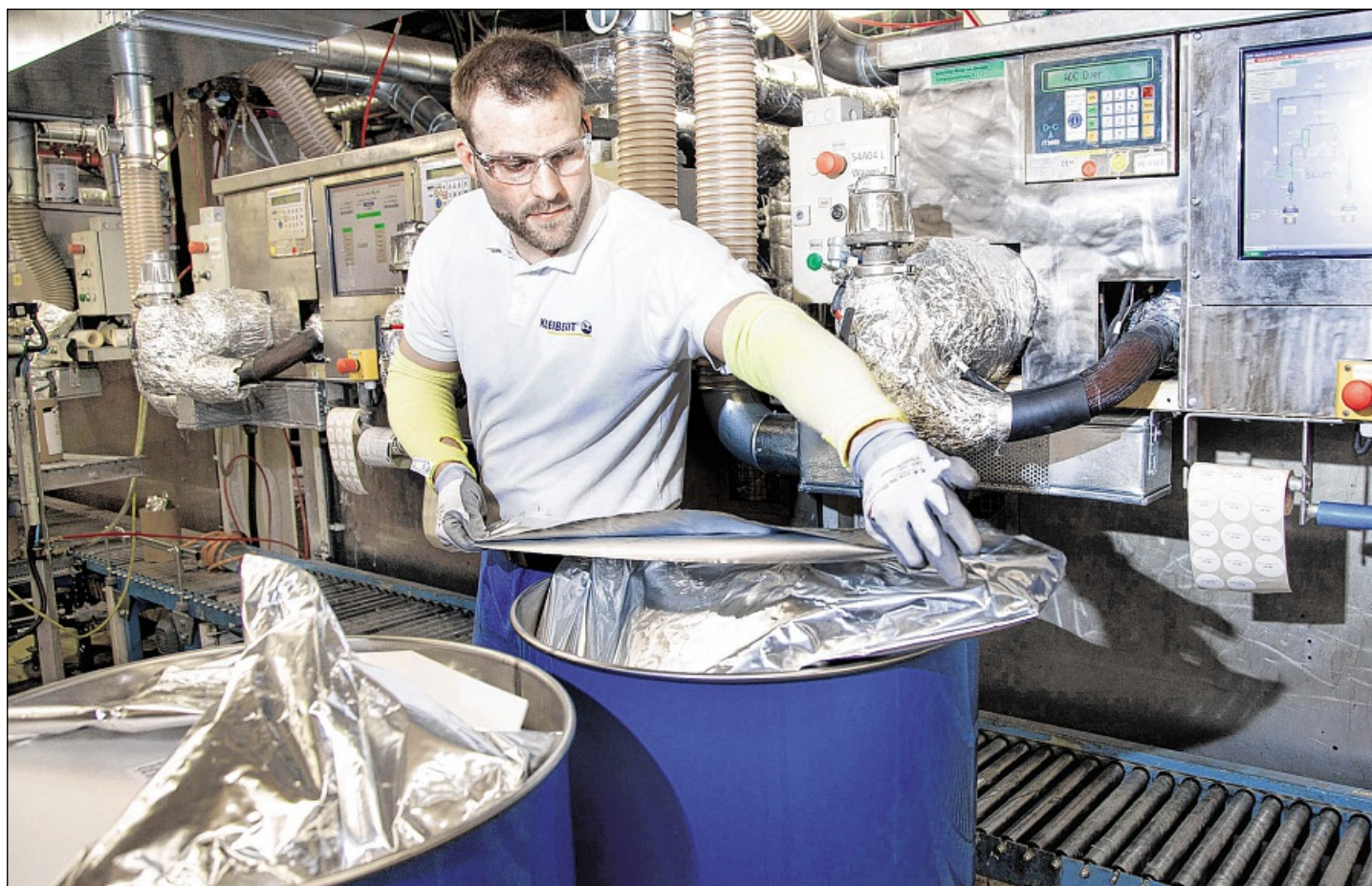
AB DAMIT INS FASS: Rund 45 000 Tonnen Kleber der Marke Kleiberit sollen in diesem Jahr in Weingarten hergestellt werden. Das Foto zeigt heißen Schmelzklebstoff. Das Unternehmen hat allein 500 Standardprodukte im Sortiment.